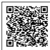
ビジターセンター Instagram